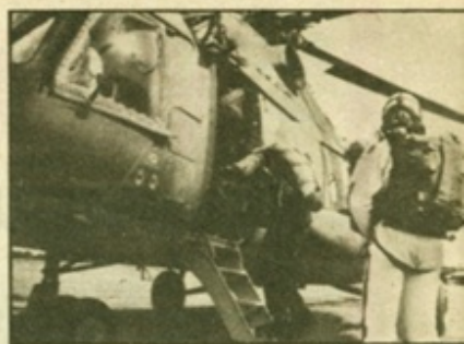
Einstieg zum Start im Turbinenhubschrauber Mi-8, der für das Figurenspringen eingesetzt wurde. Erst während des Flugs wird die Startreihenfolge ausgelöst

dem Flugplatz wachten mit Argusaugen die Schiedsrichter. Jede kleine Ungenauigkeit belegten sie mit Strafzeiten, die zur reinen Komplexzeit aufgeschlagen wurden. Damit den Unparteiischen ja nichts entging, standen ihnen für die Beobachtung der Springer Spezialferngläser zur Verfügung. Irina Klabuhn erreichte eine Zeit von 9,6 s. Nicht schlecht, aber für eine Medaille reichte das nicht. Die spätere Weltmeisterin, Maja Kostina aus der Sowjetunion, schaffte den Figurenkomplex beim ersten Sprung in 7,5 s, und Jean-Claude Armaing, der französische Weltmeister bei den Männern, gar in 6,8 s! Auch die anderen Springer unserer