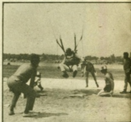
Ein Zielsprung ist erst dann erfolgreich beendet, wenn das „Zielbein“ die Nullscheibe berührt